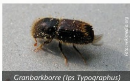
Granbarkborre ( Ips typographus )

Granbarkborren är en av de värsta skadedörarna i svenskt skogsbruk. 2020 dödades 7,9 miljoner kubikmeter gran.